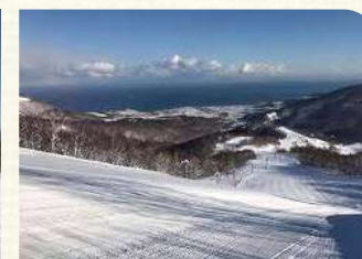
朝里川温泉スキー場