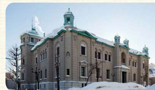
日本銀行旧小樽支店金融資料館