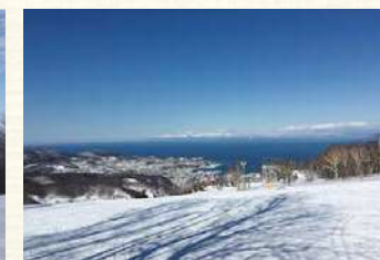
小樽天狗山スキー場